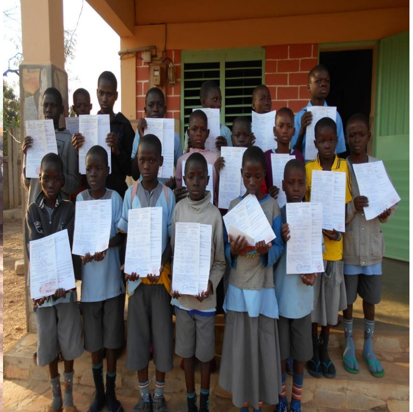
Image de quelques enfants ayant obtenu l'acte de naissance