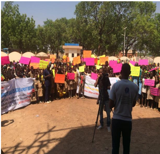
Les participants du Raffut à Tanguiéta

L'idée de faciliter la déclaration des naissances dans la zone sanitaire Tanguiéta Matéri Cobly est partie d'un constat sur le terrain : le constat selon lequel, la plupart des enfants handicapés ne possèdent pas un acte de naissance. Or dans les différentes écoles, la demande de ce document devenait pressante pour les enfants de l'ONG ECL'IPSE qui devaient se présenter aux examens.