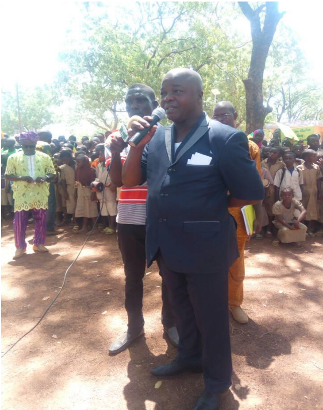
Réponse du maire suite au message délivré par les enfants handicapés et non handicapés