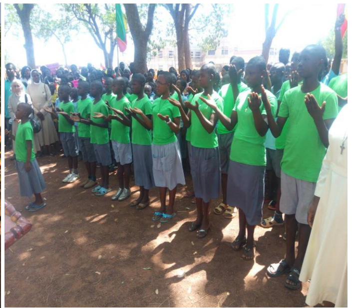
Exécution de l'hymne national en langue de signes par les enfants handicapés auditifs de Peporiyakou à Tanguiéta pour le raffut 2018

Ainsi, grâce au partenariat entre les sœurs des Sœurs des Saints Sacré Cœurs et l'OP , cette dernière a pu introduire la demande d'établissement d'acte de naissance pour une centaine d'enfants handicapés, profitant du fait que les Sœurs avaient bénéficié d'un projet de déclaration de naissance.