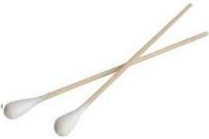
Bastoncillo de algodón