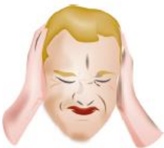
Dolor de cabeza